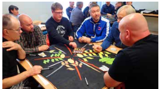
Keslan arvoja käsiteltiin 2019 mm. esimieskoulutuksen työpajoissa, joita pidettiin kaksi.