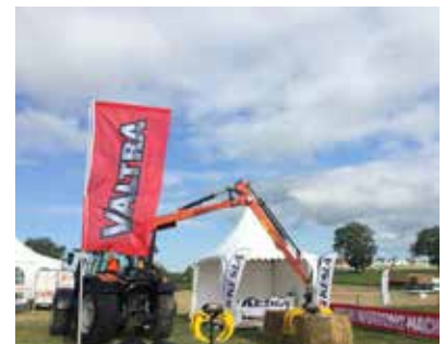
Kuva Ranskan Grass Fair -messuilta, jossa Keslalla ja Valtralla oli osin yhteinen osasto.