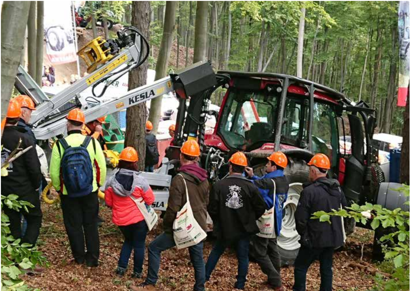
KESLA-traktorivarusteet olivat esillä Astrofomassa Keslan pitkäaikaisen yhteistyökumppanin Land- und Forsttechnik Lunzerin osastolla.

Yhtiöllä ei ole ollut valuutanvaihtosopimuksia tilikausilla 2019 ja 2018.