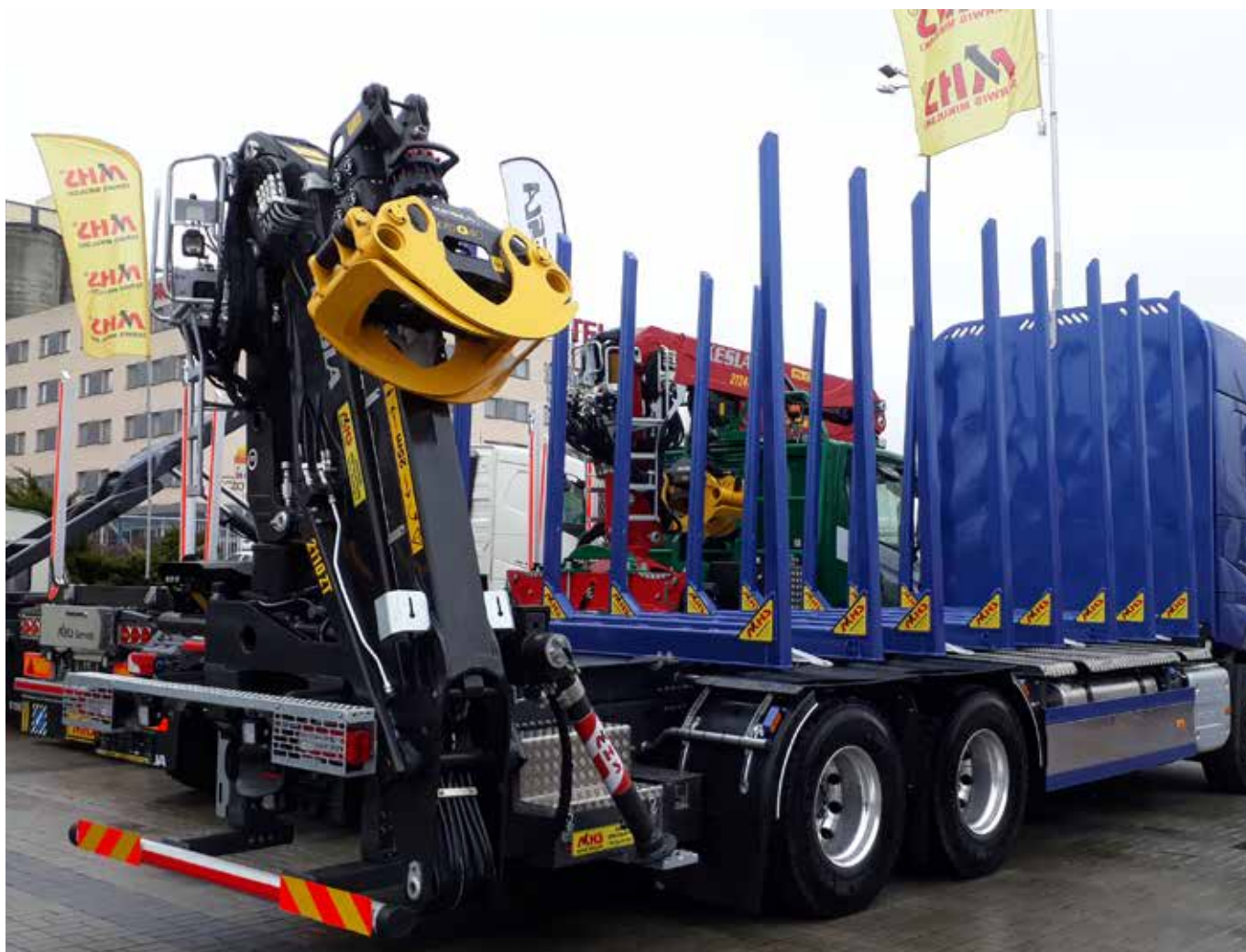
KESLA-autonosturit esillä Puolan messuilla pitkäaikaisen yhteistyökumppanimme MHS:n osastolla.

Tällä hetkellä IASB ei ole julkistanut uusia standardeja ja tulkintoja, joilla olisi merkittävää vaikutusta konsernin 1.1.2020 alkavaan tilikauteen