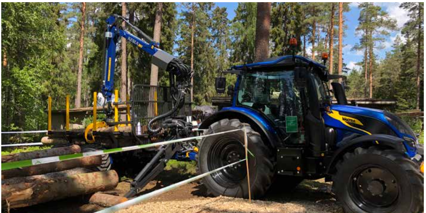
Elmia-messut Ruotsissa olivat vahvat messut traktorivarusteille. Kuva Keslan yhteistyökumppanin Lantmännenin osastolta.

Yhtiöjärjestyksen mukaan A-lajin osakkeille maksettava osinko voi olla kaksinkertainen B-lajin osakkeille maksettavaan osinkoon verrattuna.