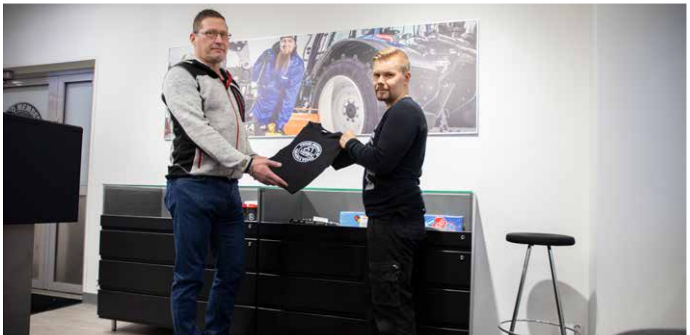
Keslan varaosamyymälässä esillä on muutakin kuin varaosia.

Tunnuslukujen laskentaperiaatteissa ei ole tapahtunut muutosta lukuun ottamatta investointien vaihtoehtoisia tunnuslukuja, jotka sisältävät IFRS 16 -vuokrasopimusten vaikutukset.