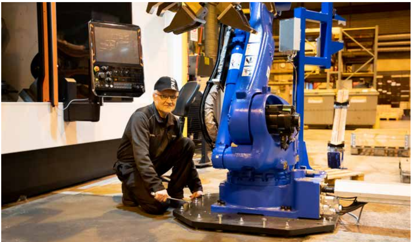
Kesla investoi 2019 mm. Iломantsin tuotantolaitoksen monitoimisorvauskeskukseen, joka asennettiin vuoden lopussa.

Kesla osti MFG Components Oy:n (Tohmajärvi) vuonna 2007 ja fuusioi yhtiön Kesla Components Oy:n (Iломantsi) vuonna 2008. Iломantsin tehdas siirtyi osaksi konsernin emoyhtiö Kesla Oyj:tä 1.7.2016 alkaen konsernin sisäisellä liiketoimintakaupalla, jonka jälkeen MFG Components Oy:n toiminta keskittyi täysin Tohmajärven tehtaalle. Tohmajärvellä yhtiö harjoitti oman valmistustoiminnan ohessa voimansiirtoon liittyvien tuotteiden välityskauppaa tilikauden 2017 kolmannen kvartaalin loppuun, jolloin valmistusliiketoimintaan liittyvä liiketoiminta myytiin liiketoimintakaupalla Kotka Power Tech Oy:lle. 1.10.2017 alkaen yhtiö harjoitti ainoastaan voimansiirron maahantuontiin liittyvää välityskauppaa 30.9.2018 asti. MFG Components Oy:n järjestelyiden jatkumona voimansiirron maahantuonti -liiketoiminta myytiin liiketoimintakaupalla elokuussa 2018 Tools Finland Oy:lle. Lokakuusta 2018 alkaen MFG Components Oy:n liiketoiminta koostui jäljelle jääneen vaihto-omaisuuden realisoinnista, joka saatettiin loppuun kesäkuussa 2019.