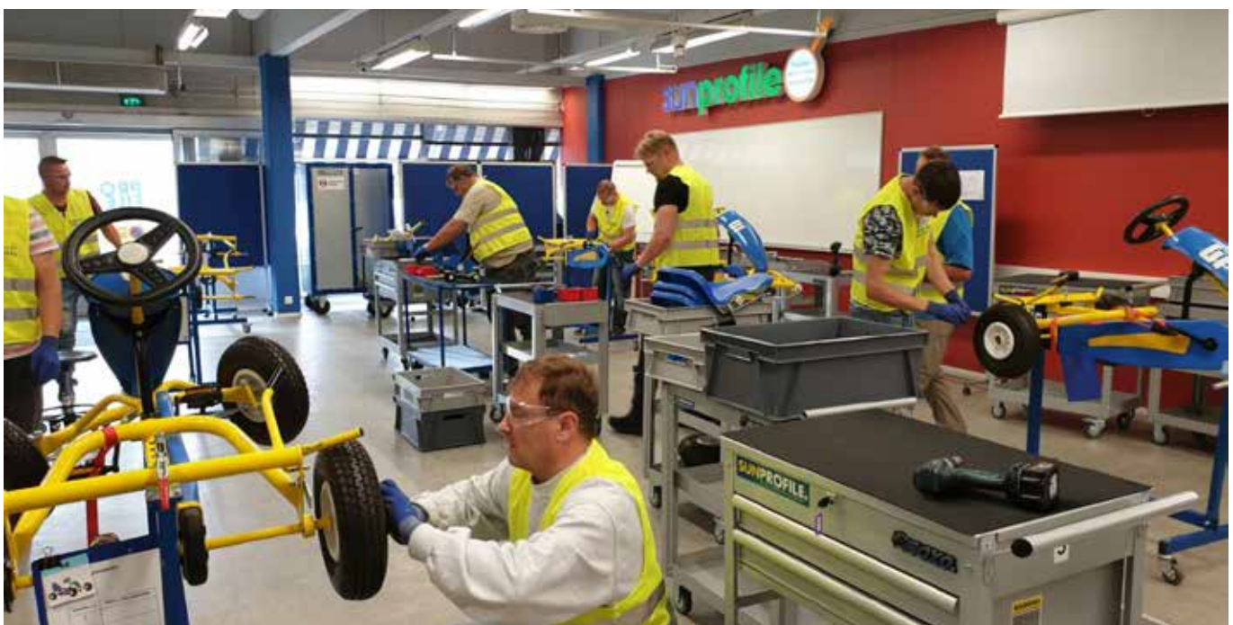
Kesla aikoo hyödyntää Lean-menetelmiä entistä tehokkaammin eri toiminnoissa. Kuva eräästä vuoden 2019 Lean-koulutuksesta.