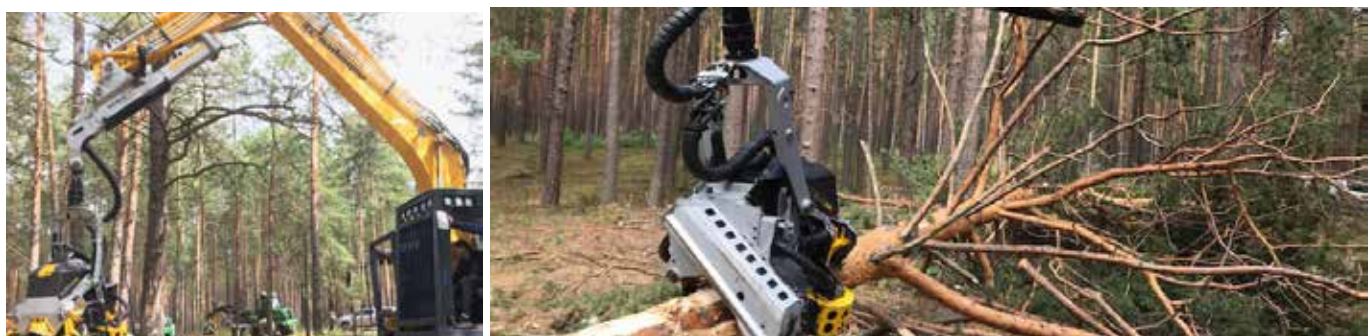
Keslan pitkäaikainen yhteistyökumppani valkovenäläinen Amkodor esitteli Venäjällä kaivuriharvesteriaan.

Ostovelat ja muut velat sisältävät lopetettujen toimintojen osuutta 3 tuhatta vuonna 2019 (15 tuhatta vuonna 2018).