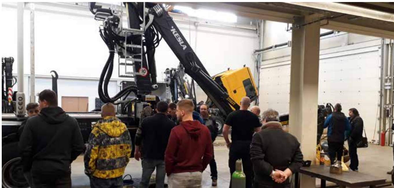
Kesla järjesti vuoden 2019 aikana useita pieniä koulutustapahtumia yhteistyökumppaneilleen. Kuva Venäjältä.

Tehty analyysi osoitti, ettei standardin käyttöönotolla ollut merkittävää vaikutusta yhtiön nykyisiin tulouttamiskäytäntöihin. Yhtiö siirtyi IFRS 15 -standardin käyttöön 1.1.2018 alkaen soveltaen käyttöönotossa täysin takautuvaa menetelmää.