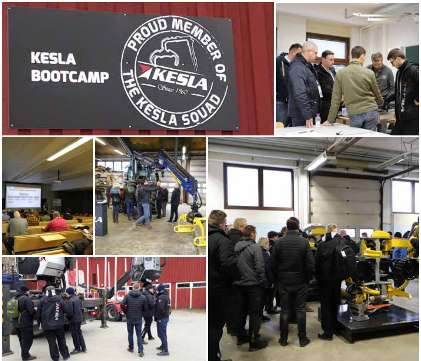
Vientijälleenmyyjien koulutuspäivät Koivikon kartanolla huhtikuussa.