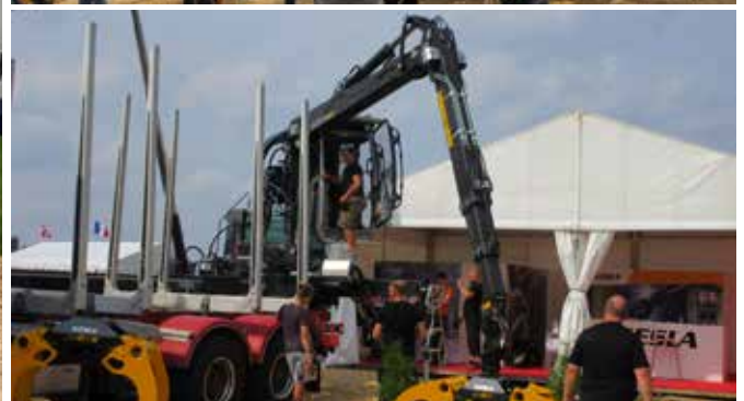
KESLA-tuotteita Elmia Lastbil-messuilla Ruotissa elokuussa.