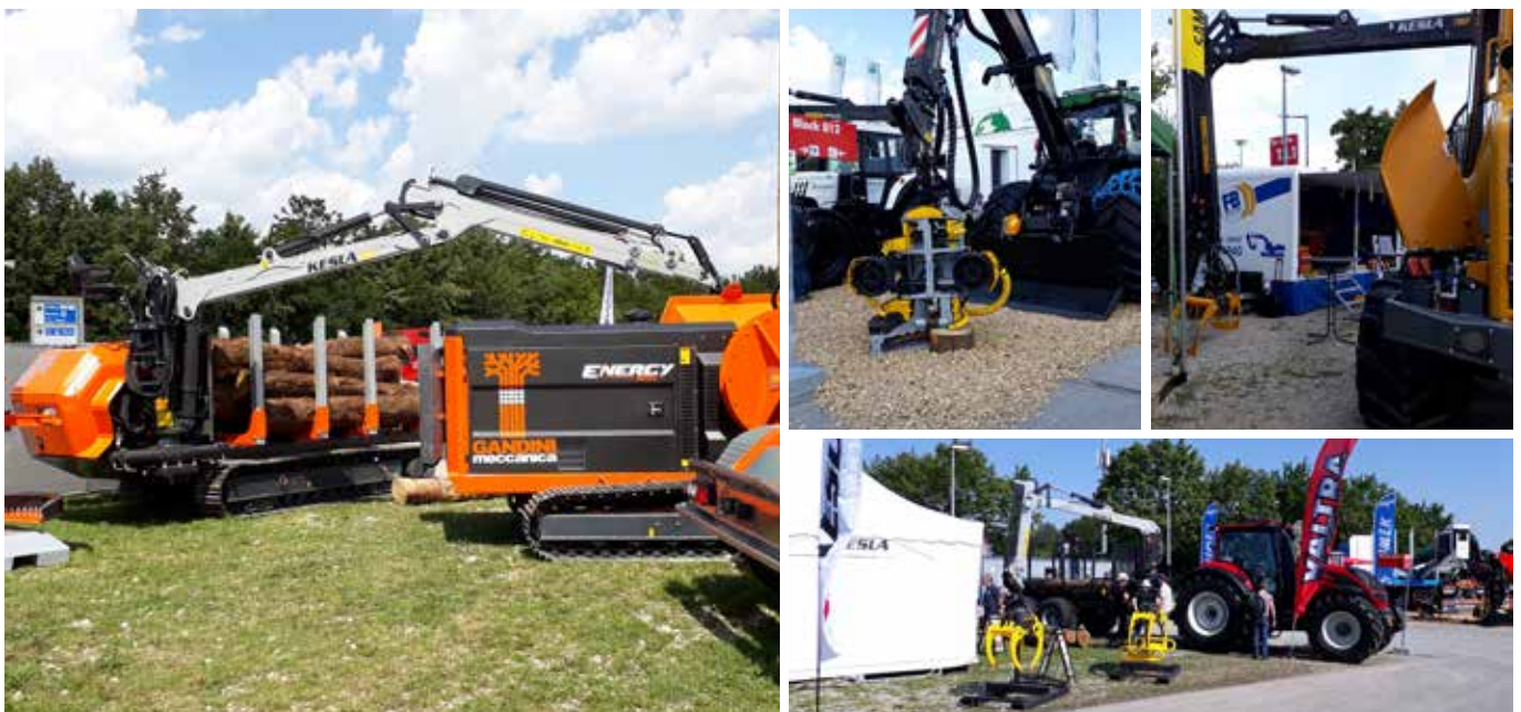
KESLA-tuotteet olivat esillä paitsi yrityksen omalla myös eri yhteistyökumppaneiden osastoilla Saksan KWF:ssä.

Yhtiöllä ei ole ollut valuuttavaihtosopimuksia tilikausilla 2018 ja 2017.