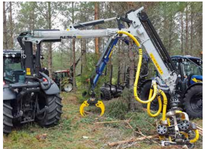
Gallringsdagarna Ruotsissa syyskuussa.

MFG Components Oy:n metsäkone-segmentille osia pääasiassa toimittava Ilomantsin tehdas siirrettiin konepajajärjestelmistä osaksi metsäkoneita 1.7.2016 toteutuneella konsernin sisäisellä liiketoimintakaupalla.