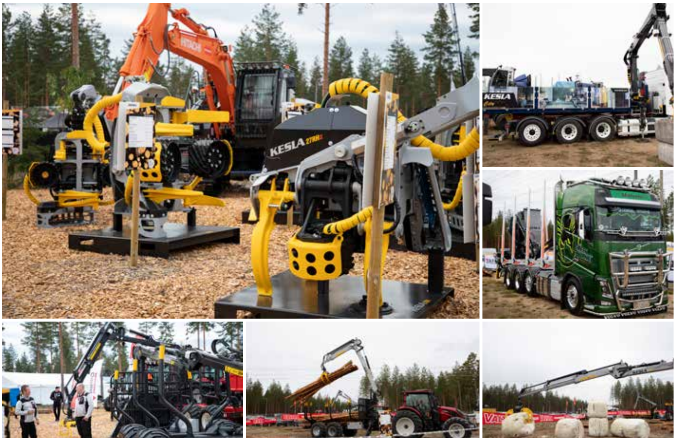
Vuoden päämessut olivat joka toinen vuosi Jämsässä pidettävä FinnMETKO.