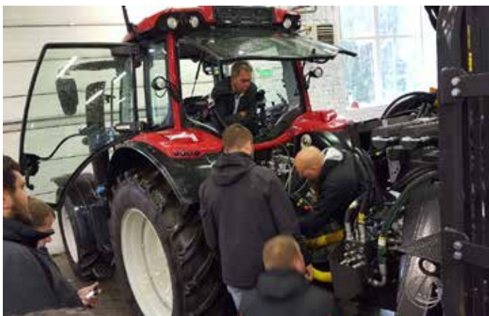
KESLA-tractorivarusteiden AGCO-yhteistyötä laajennettiin Latviaan ja Norjaan.