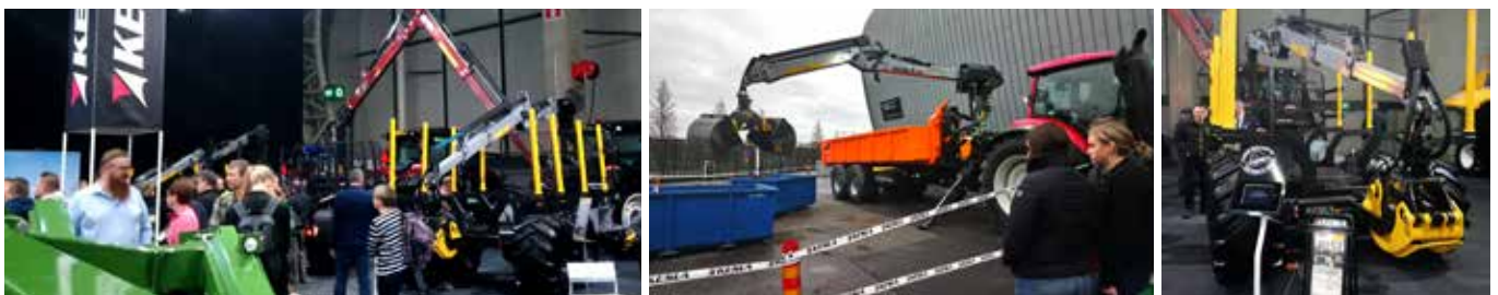
KESLA-tractorivarusteet ml. uudet metsäperävaunut olivat esillä Konemessuilla AGCO Suomen osastolla marraskuussa.

Henkilöstön keskimääräinen lukumäärä on keskiarvo kalenterikuukausien lopussa lasketuista henkilökunnan lukumääristä, joissa on huomioitu lomautusten vaikutus.