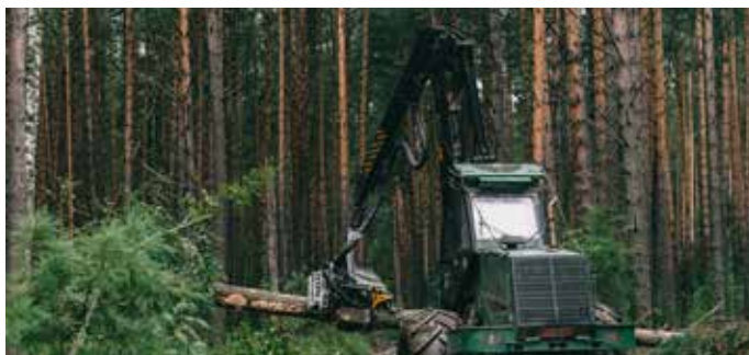
Keslan pitkäaikaisen yhteistyökumppanin Amkodorin koneita Valkovenäjällä