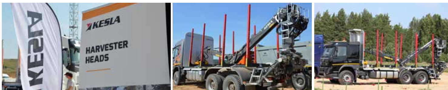
KESLA-tuotteita Lesorub-tapahtumassa Venäjällä.

Takuuaika on normaalisti 12 kuukautta. Takuun aikana havaitut takuuehdot täyttävät viat korjataan takuuehtojen mukaisesti joko korjaamalla viallinen osa tai vaihtamalla se uuteen. Tilinpäätöksessä 2018 esitetty takuuvaraus on mitoitettu kattamaan vuonna 2018 myytyjen tuotteiden arvioituja takuukustannuksia, jotka voivat toteutua vuoden 2019 aikana. Yhteen tuotteeseen liittyvän laakerivian takuukustannusten kattamiseksi tehty ylimääräinen takuuvaraus 110 tuhatta euroa sisältyy 31.12.2018 taseen varaukseen (132 tuhatta euroa vuonna 2017). Ylimääräistä varausta puretaan toteutuneiden takuukustannusten perusteella.