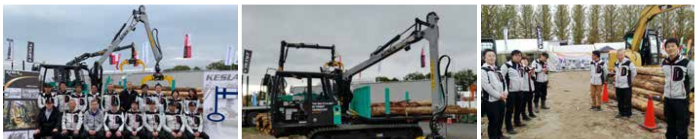
Kesla Japanin metsämessuilla marraskuussa pitkäaikaisen yhteistyökumppanien kanssa.